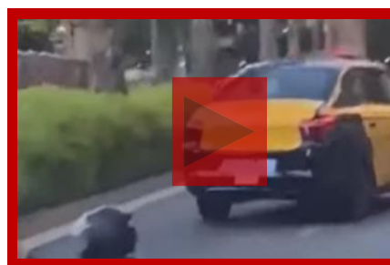
Causan un accidente y se dan a la fuga para evitar las consecuencias.

Pero... ¿Y los agresores? ¿Cuántos españoles reconocen haber realizado estas conductas? Alrededor de 850.000 conductores de nuestro país (3%) admiten haber dañado otro coche adrede y 3,1 millones (11%) haber abandonado el lugar de un accidente sin dejarle ningún dato al perjudicado, un comportamiento muy habitual cuando el propietario del otro coche no se encuentra presente ( 71% de las veces).