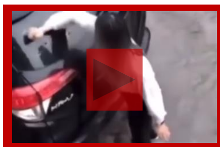
Provocan daños intencionadamente en un vehículo.

De esta manera, 12,3 millones de automovilistas (45%) afirman haber sufrido vandalismo en sus coches en alguna ocasión y 11,7 millones (43%) se han encontrado su coche con daños sin que el otro conductor le haya dejado sus datos.