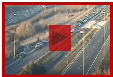
Salida de vía con vuelco

El accidente más frecuente en verano es la salida de vía , aunque también aumentan las colisiones frontales , los vuelcos y los choques contra obstáculos, unos tipos siniestros muy relacionados con la fatiga y las distracciones en la conducción y de los que, a continuación, se adjuntan algunos ejemplos: